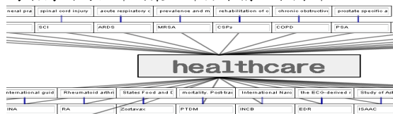
圖 3 Healthcare 領域相關的部份架構

透過關鍵字 Healthcare 檢索摘要中含有 Healthcare 的論文，取得 8031 篇文獻，詞彙共 2493 個；透過部份自然語言處理分析、詞頻分析方法，再加上關係數演算法擷取出關係數大於 0.02 的概念，最後建構出領域相關的詞彙架構，並利用 Flash 建構出 Healthcare 研究領域相關的詞彙架構，第一層是與 healthcare 直接相關的縮寫詞，第二層為縮寫詞的全部詞彙，部份架構如下圖所示。